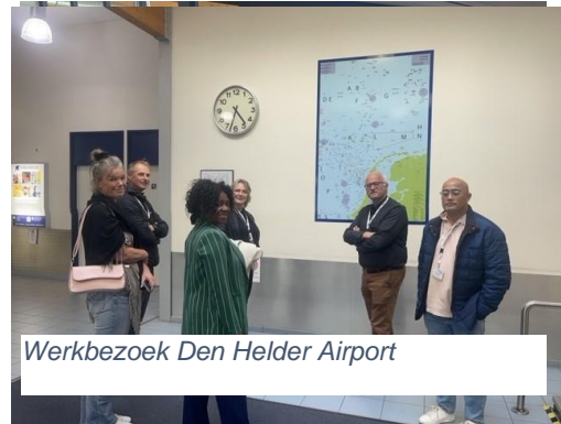
Werkbezoek Den Helder Airport