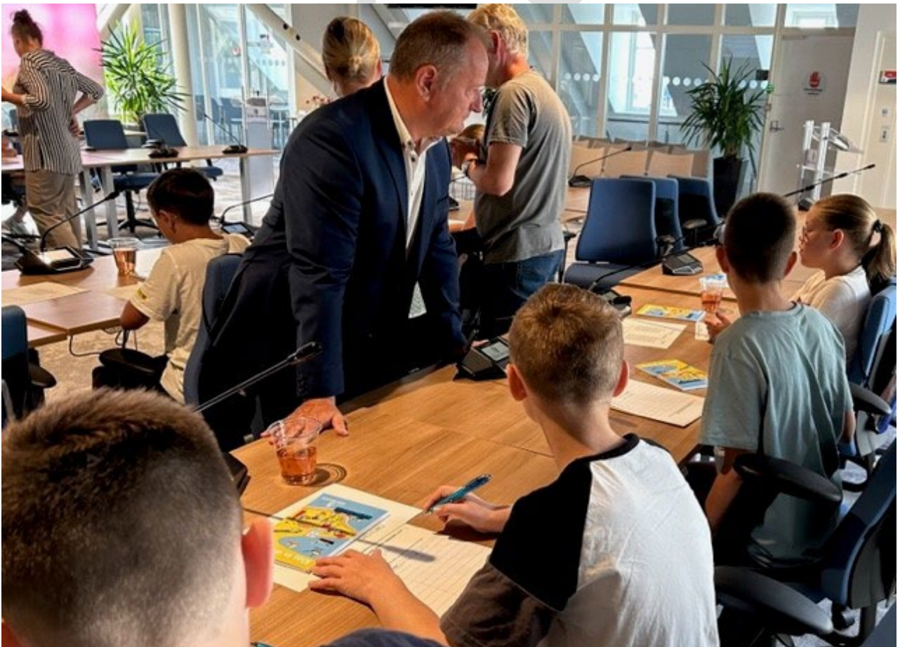
Indruk van Klas in de Raad