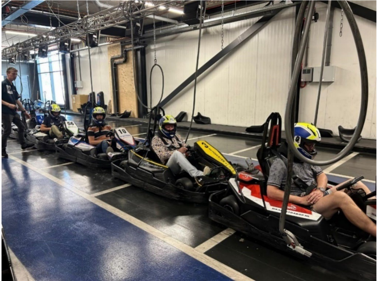
Collega's bij de griffie, tegenstanders op de kartbaan