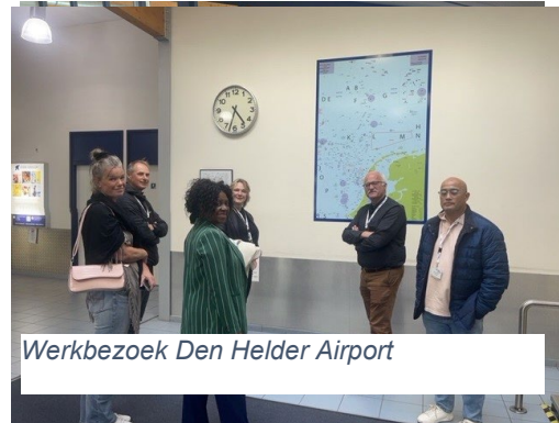
Werkbezoek Den Helder Airport