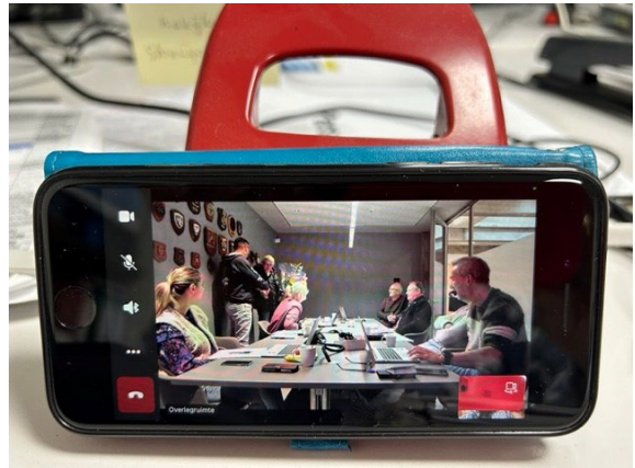
Griffie-overleg op afstand

Van twee medewerkers is dit jaar afscheid genomen; een medewerker is met ingang van april bij een andere gemeente gaan werken en de andere medewerker heeft na langdurige ziekte afscheid genomen.