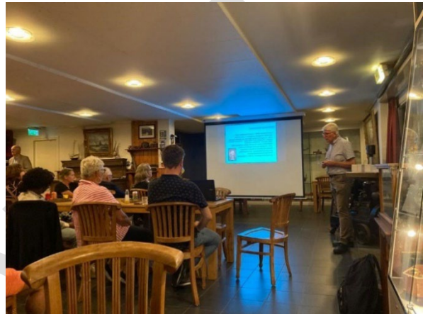
Indruk van de wijkbezoeken