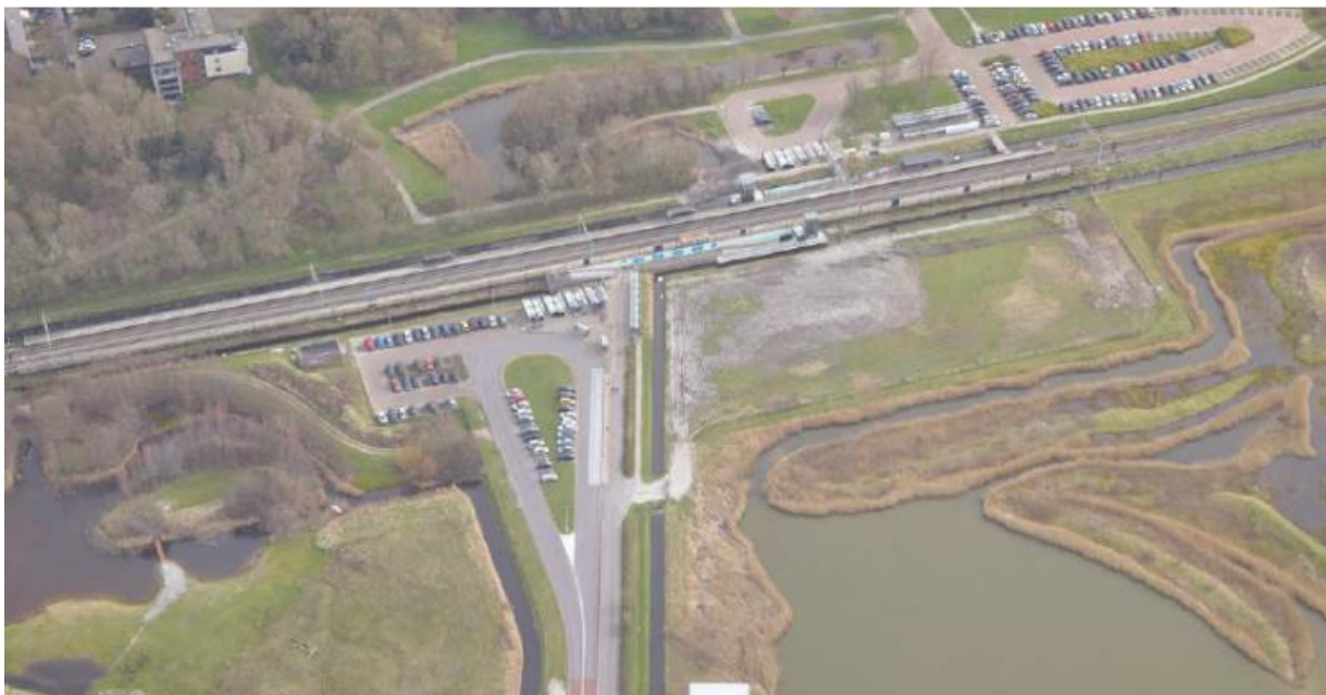
Afbeelding: weergegeven is het plangebied in de huidige situatie. Zichtbaar is de spoorlijn Den Helder-Alkmaar.

Uit dit door onderzoeksbureau Kragten uitgevoerde akoestisch onderzoek, d.d. 7 december 2023, blijkt dat de voorkeursgrenswaarde ter plaatse van bepaalde gevels niet gerespecteerd wordt en dat er een ontheffing nodig is voor de geluidwaarden. In dit document wordt daarvoor de motivering gegeven.