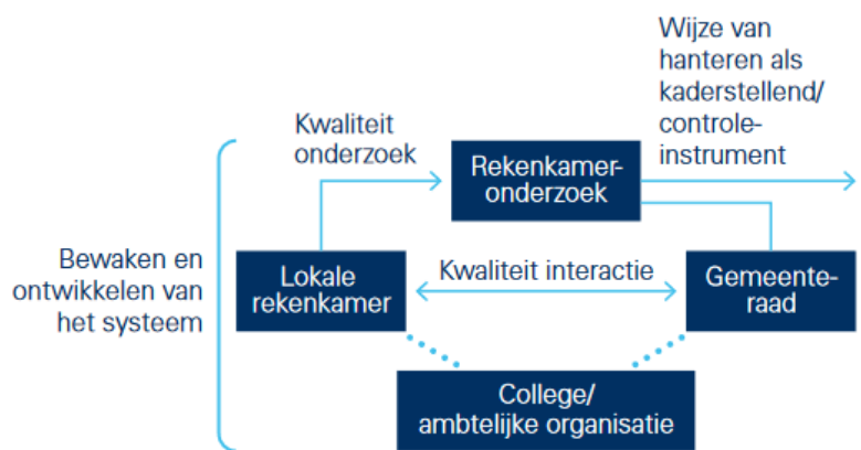
Figuur 1. De relatie tussen de lokale rekenkamer en de gemeenteraad

In 2019 heeft de Werkgroep lokale rekenkamers onderzoek gedaan naar de stand van zaken van lokale rekenkamers. Uit het onderzoek komt naar voren dat de lokale rekenkamer gezien kan worden als iets wat de werkgroep een 'kwetsbaar raadsinstrument' noemt. Kwetsbaar, vanwege de politiek-bestuurlijke context waarin de rekenkamer opereert en waarin zij spanningen kan veroorzaken omdat de rekenkamer raakt aan de relatie tussen de raad en het college (zie figuur 1, overgenomen uit het rapport van de Werkgroep lokale rekenkamers). 43