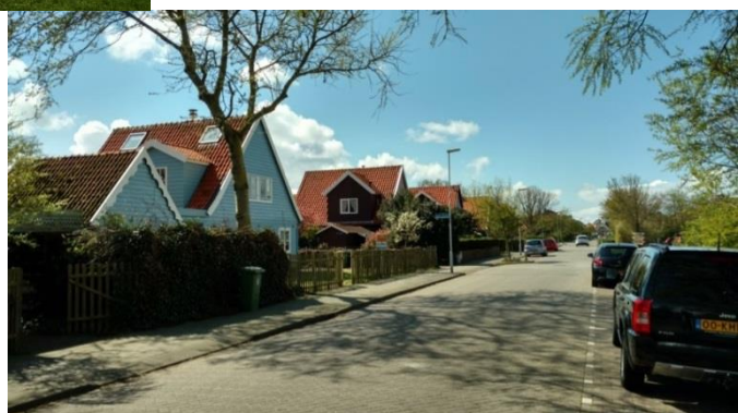
Afbeelding: Badhuisstraat met typische 'Oostenrijkse woningen'