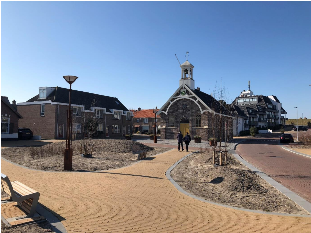
Afbeelding: Het Dorpsplein is heringericht als aantrekkelijk, groen en autoluw verblijfsgebied

We hebben de ambitie om de kwaliteit van het verblijfsgebied op het Dorpsplein, dat momenteel loopt tot aan de Zeeweg en de voet van de Helderse Zeewering, verder door te trekken tot aan Fort Kijkduin. Hierdoor wordt dit gebied, waar de toeristische en recreatieve activiteiten van Huisduinen zich concentreren, aantrekkelijker voor bezoekers en krijgt langzaam verkeer ook daar meer ruimte ten opzichte van de huidige situatie. De aanleg van een aantrekkelijke dijkopgang, in aansluiting op de recente herinrichting van het Dorpsplein, biedt ook een kwalitatieve impuls aan het gebied en maakt de relatie tussen de dijk en het Dorpsplein, als centrum van Huisduinen sterker. Hiermee ontstaat een aantrekkelijk gebied voor bewoners en bezoekers ontstaan, lopend van het Dorpsplein langs de dijk tot aan het Fort Kijkduin en het strand.