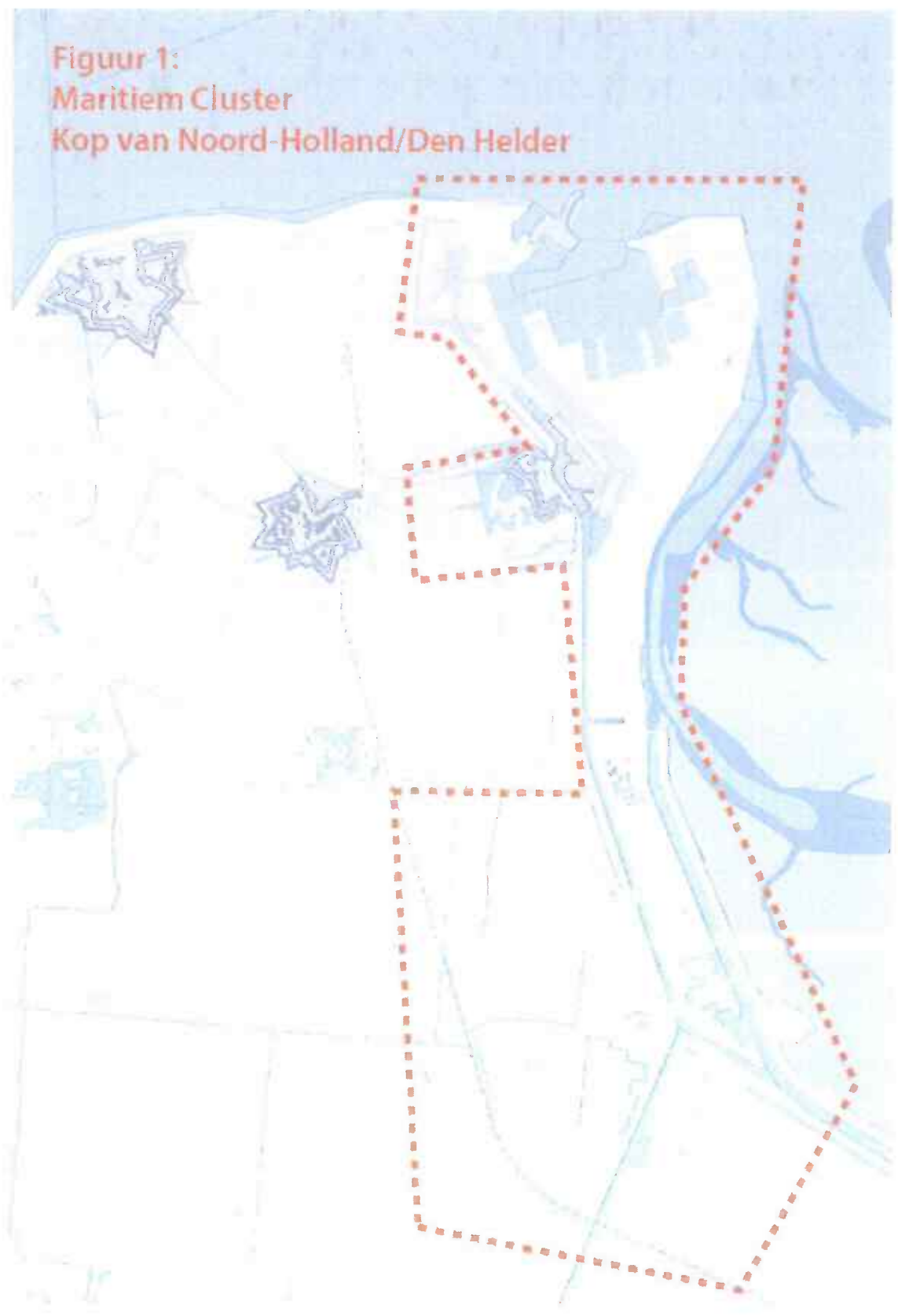
Figuur 1: Maritiem Cluster Kop van Noord-Holland/Den Helder