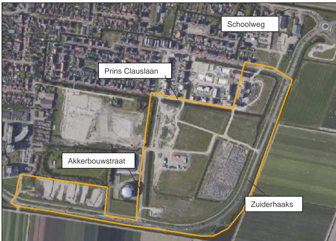
Figuur 1-1 Situatie plangebied

Figuur 1-1 bevat een overzicht van de situatie ter plaatse. In bijlage 1 is meer informatie betreffende de situatie gegeven.