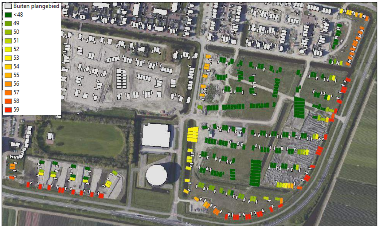
Figuur 4-3 Gecumuleerde geluidsbelasting, L_{den} in dB, ten gevolge van wegverkeer op alle wegen samen, exclusief aftrek conform artikel 3.4 uit het RMG 2012