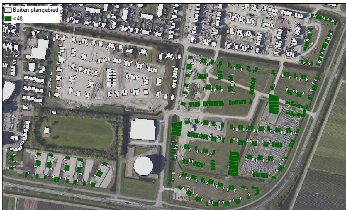
Figuur 4-1 Overzicht cumulatieve geluidsbelasting, L_{den} in dB, ten gevolge van wegverkeer op de Schoolweg inclusief aftrek conform artikel 3.4 uit het RMG 2012

De toetsingswaarde ten gevolge van verkeer over de Schoolweg bedraagt ten hoogste 38 dB ( L_{den} ) inclusief aftrek conform artikel 3.4 uit het RMG 2012. Het gaat hierbij om het gedeelte met een wettelijke rijsnelheid van ten hoogste 50 km/uur. De geluidsuitstraling van dit weggedeelte is getoetst ter plaatse van de gevels van de nieuw te bouwen woningen. In figuur 4-1 is de berekende geluidsbelasting op de gevels van de geplande woningen gegeven. Bijlage 3 bevat de rekenresultaten door verkeer op dit wegdeel. De ten hoogste toelaatbare waarde van L_{den} 48 dB uit de Wet geluidhinder wordt niet overschreden. Hierdoor is vervolgonderzoek naar mogelijke bron- of overdrachtsmaatregelen niet nodig.