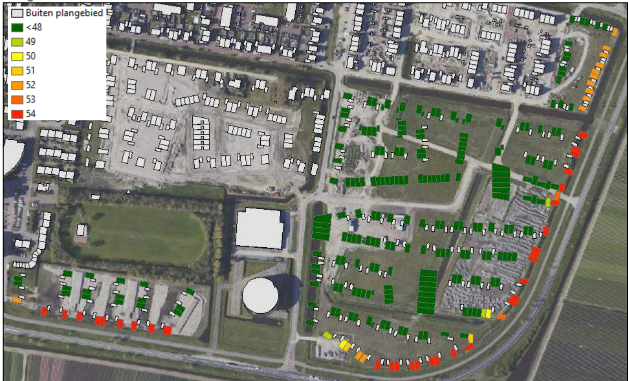
Figuur 4-2 Optredende geluidsbelasting, L_{den} in dB, ten gevolge van wegverkeer op de Zuiderhaaks inclusief aftrek conform artikel 3.4 uit het RMG 2012

Ter plaatse van de gevels van de woningen gelegen in de eerstelijns bebouwing langs de Zuiderhaak wordt de ten hoogste toelaatbare waarde van L_{den} 48 dB uit de Wet geluidhinder overschreden. Hierdoor is vervolgonderzoek naar mogelijke bron- of overdrachtsmaatregelen nodig.