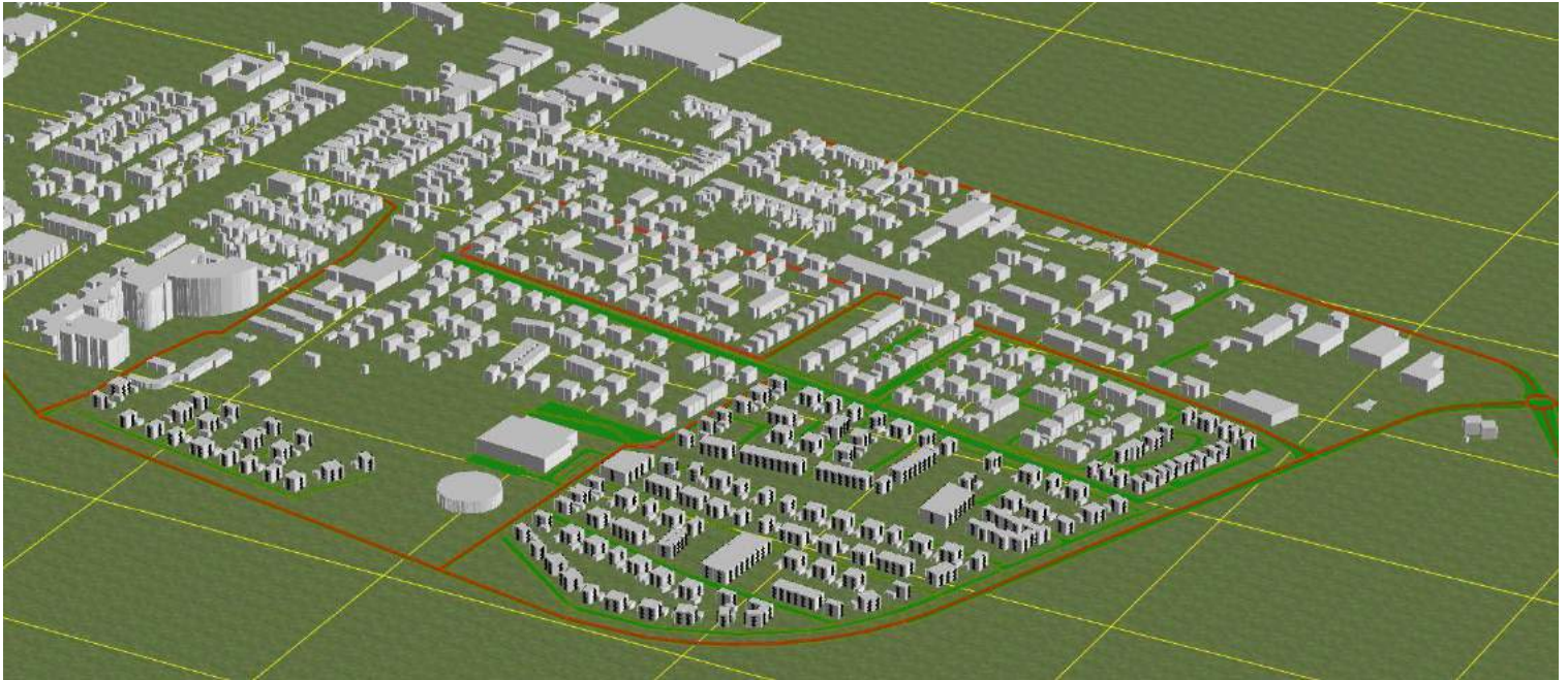
3D situatie in geomilieu 2021.1