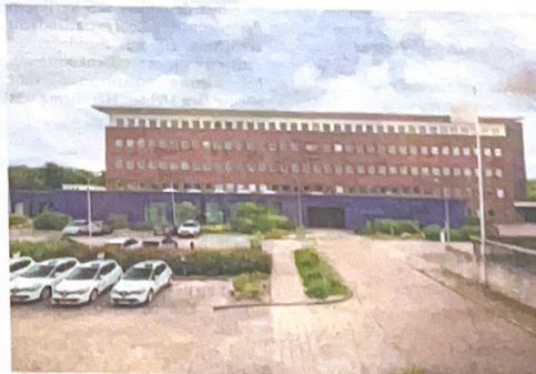
Het enorme gebouw van de Rabobank in Den Helder.

Zodoende is er na anderhalf jaar nog geen koper gevonden, aldus Caldenhove. „Het pand is gewild,