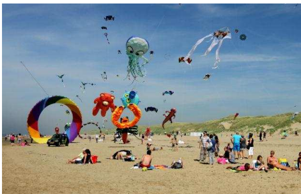
Vliegerfestival, strand Den Helder, 2011 (wordt foto 2012)