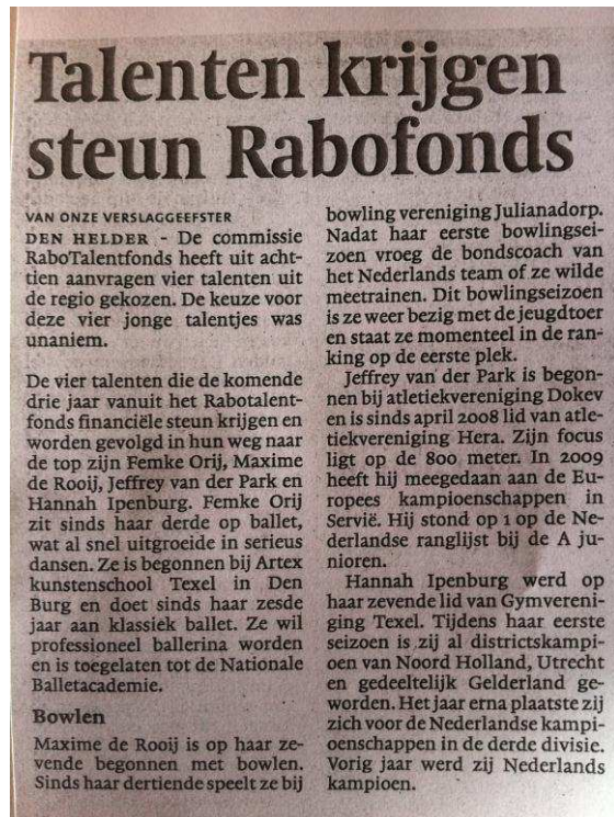
Noordhollands Dagblad, 5 januari 2012

Een goed voorbeeld van een succesvolle evenementensubsidie aanvraag is de Halve Marathon van Den Helder. De organisatie heeft naast deze subsidie een grote groep vrijwilligers aan zich gebonden in samenwerking met Sportservice Den Helder. Provincie Noord-Holland geeft op regionaal niveau financiële impulsen bij grotere sportevenementen. Scholen en bedrijven (zie onderstaande krantenartikel) willen steeds meer maatschappelijk verantwoordelijkheid nemen, bijvoorbeeld in de sportsector.