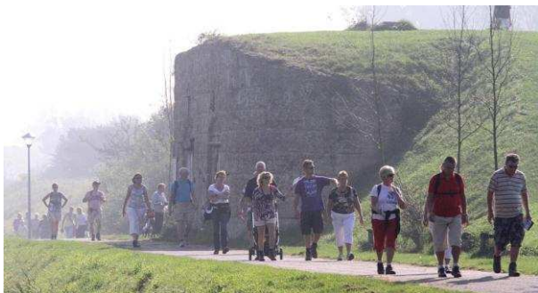
Wandeloctocht van het Noord-Holland Dagblad, 2011 (wordt foto 2012)

Stichting Strandexploitatie Noordkop (SSN) is een belangrijke gesubsidieerde uitvoeringspartij die verantwoordelijk is voor het onderhoud van en veiligheid op het strand. Daarnaast zorgt de SSN ervoor dat de recreatieve waarde van het strand wordt verhoogd. In 2012 en volgende jaren is het streven om onze positie op de lijst Schoonste strand van Nederland te verbeteren, de dienstverlening te versterken (onder meer toegankelijkheid mindervaliden) en de service aan de badgasten uit te breiden. De afgelopen jaren zijn jaarlijks blauwe vlaggen uitgereikt aan een drietal Helderse stranden en drietal jachthavens. In dit kader is het garanderen van de veiligheid op het strand voor de badgasten van belang. In het verlengde hiervan zorgt een kwalitatief schoon en veilig strand voor meer sportevenementen en aantrekkelijker recreëren.