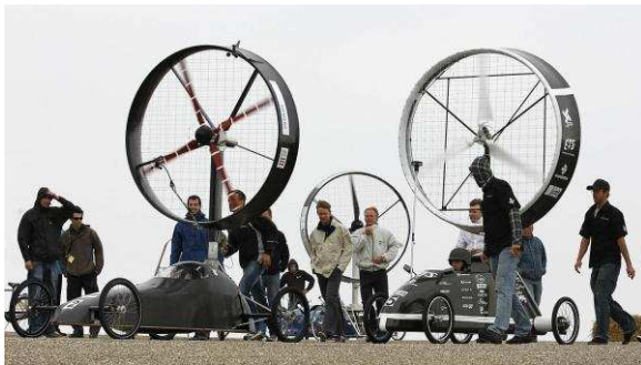
Racing Aeolus, Zeedijk Den Helder, 2012

De gemeente heeft jaarlijks een evenementenbudget beschikbaar. Ieder jaar wordt het budget verdeeld over een aantal evenementen en activiteiten. Het evenementenprogramma dat jaarlijks tot stand komt bestaat voor een groot gedeelte uit sportieve evenementen, in 2012 onder andere de Clipper Round the World Race en De Halve van Den Helder. De activiteiten (vooral lokaal en wijkgericht) die de gemeente steunt zijn de Botterrace, Racing Aeolus (zie onderstaande foto), Helder's Vliegerfestival, en het Panna Knockout toernooi. Voor 2012 én 2013 is het evenemententema 'Den Helder Kust de Zee', geïnitieerd door de citymarketingorganisatie 'Stichting Top Van Holland'. Dit thema appelleert aan de toeristische en recreatieve mogelijkheden die Den Helder biedt aan inwoner én toerist.