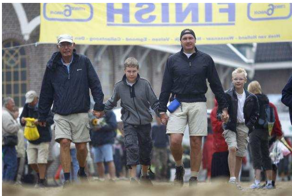
www.strand6daagse.nl , 2011

Het sportdeelname cijfer van 55-plussers, inwoners met een niet westerse herkomst, alleenstaanden, alleenstaande ouders en laagopgeleiden ligt lager dan gemiddeld. Hoogopgeleiden sporten relatief veel. De meest populaire en beoefende sport in Den Helder is fitness, gevolgd door hardlopen en krachttraining. Ook zwemmen en fietsen zijn in trek. De meeste inwoners van Den Helder sporten individueel en ongebonden; bijvoorbeeld tijdens de strandzesdaagse van Hoek van Holland naar Den Helder (zie onderstaande foto).