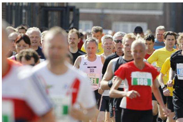
Halve Marathon van Den Helder, 2011

Gezien de leeftijd van de huidige groep vrijwilligers in Den Helder is het voor sportverenigingen en sportevenementen van belang om meer vrijwilligers te gaan werven én behouden. De maatschappelijke stage voor scholieren (voortgezet onderwijs) kan hier een belangrijke rol in spelen, mits partijen met elkaar samenwerken en sportverenigingen openstaan voor deze nieuwe manier om jongeren te interesseren voor het vrijwilligerswerk. Tijdens de Halve Marathon van Den Helder is er ieder jaar een groep scholieren die hun maatschappelijke stage uitvoeren voor en tijdens dit evenement (zie bovenstaande foto).