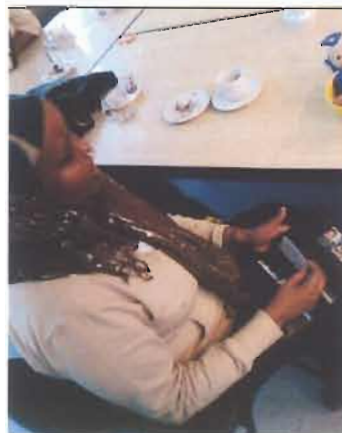
Bijeenkomst in het Internationaal Vrouwencentrum (IVC)

Binnen de looptijd van het project is voor de ontwikkeling van een lespakket voor allochtone doelgroep te weinig tijd en financiële middelen overgebleven. Er is op redelijk intensieve schaal geprobeerd contact te leggen met allochtone doelgroepen, in 1 o instantie via de eigen geloofsgemeenschappen. Het is echter moeilijk gebleken deze doelgroep(en) te bereiken. Binnen het project heeft dit – behoudens de contacten met en de bijeenkomst bij het I.V.C. – geen vervolg gekregen.