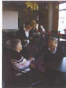
bijeenkomsten voor mantelzorgers