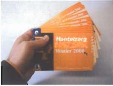
Hoe een mantelzorgwaaier eruit zou kunnen zien.