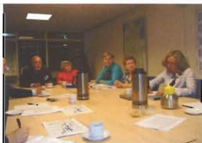
De Begeleidingsgroep in vergadering