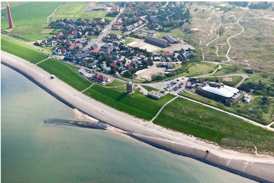
Huisduinen vanuit de lucht

Huisduinen is in het begin van de 8e eeuw ontstaan als één van eerste plekken in Den Helder waar mensen zich gingen vestigen. In de loop der eeuwen is Huisduinen afwisselend een eiland en een schiereiland geweest. De strijd tegen het water is kenmerkend in de geschiedenis van het dorp. In de 17 e eeuw is de Zanddijk aangelegd, waardoor Huisduinen definitief tot het vasteland ging behoren. Duinen vormden zich vervolgens tegen deze nieuw aangelegde zeedijk. Nog steeds ligt Huisduinen op de grens van dijk en duin. De Grafelijkheidsduinen, ten zuiden, en het Huisduiner poldertje, ten noorden, scheidden het dorp van Nieuw Den Helder. In het westen vormt de Helderse Zeedijk en het begin van de duinenrij, met daarachter de zee, een natuurlijke barrière.