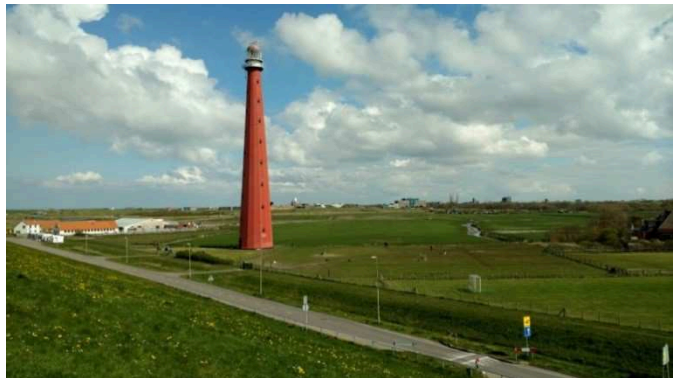
Het Huisduiner poldertje en de iconische 'Lange Jaap'

De Grafelijkheidsduinen en Donkere Duinen bestaan van west naar oost uit een zeereep, een reliëfrijk duinlandschap met valleicomplexen, en vervolgens een bosrijke binnenduinrand. Het gebied is als Natura 2000-gebied onderdeel van het Natuurwerk Nederland (NNN). Het Natuurnetwerk Nederland is het Nederlands netwerk van bestaande en nieuw aan te leggen natuurgebieden. In de wet heet dit de Ecologische Hoofdstructuur (EHS). Het netwerk moet natuurgebieden beter verbinden met elkaar en met het omringende agrarisch gebied, hiermee moet de achteruitgang van de biodiversiteit in Nederland worden tegengegaan. Naast de natuurwaarde van de Grafelijkheidsduinen is het gebied vanuit cultuurhistorisch oogpunt ook interessant, met ondermeer het waterleidingsterrein en diverse bunkers uit de Tweede Wereldoorlog. In het verleden is er sprake van geweest om ook de Huisduiner polder aan te wijzen als NNN, vanwege aanwezige natuurwaarde en natuurpotentie. Op dit moment heeft dit gebied een agrarische functie, met een groene en grotendeels open uitstraling. In Huisduinen wordt veel waarde gehecht aan het vasthouden van het huidige karakter, eventueel in combinatie met natuurontwikkeling die binnen dit karakter past.