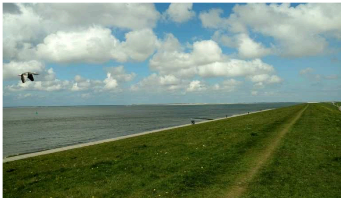
Uitzicht over de zee en Texel vanaf de Helderse Zeedijk