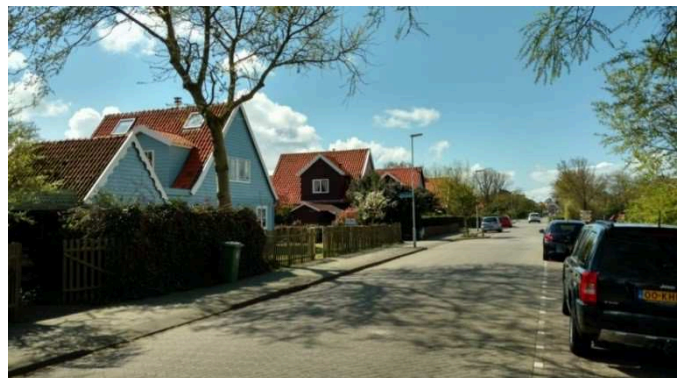
Badhuisstraat met typische 'Oostenrijkse woningen'