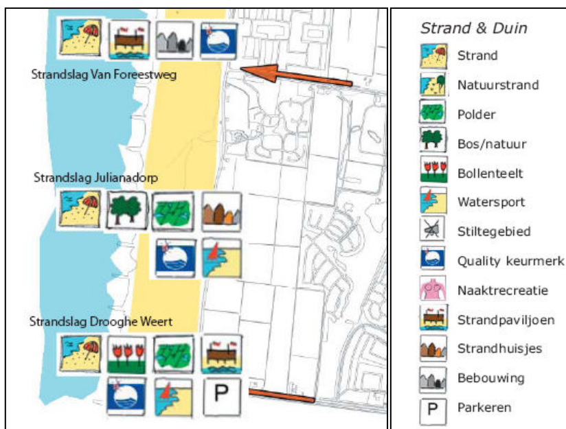
Toekomst strandslagen Julianadorp aan zee

Het hierbij horende toekomstbeeld bestaat uit het aansluiten van de strandopgangen op de wegen binnen het kenmerkende grid van het poldergebied. Hierdoor krijgt de zone strand en duin meer aansluiting op het achterland. Op het strand tussen de nieuw te realiseren strandslag Van Foreestweg en strandslag Julianadorp worden strandhuisjes toegestaan. Op afbeelding op de volgende pagina wordt duidelijk welke functies op het strand en in het duingebied kunnen worden gerealiseerd.