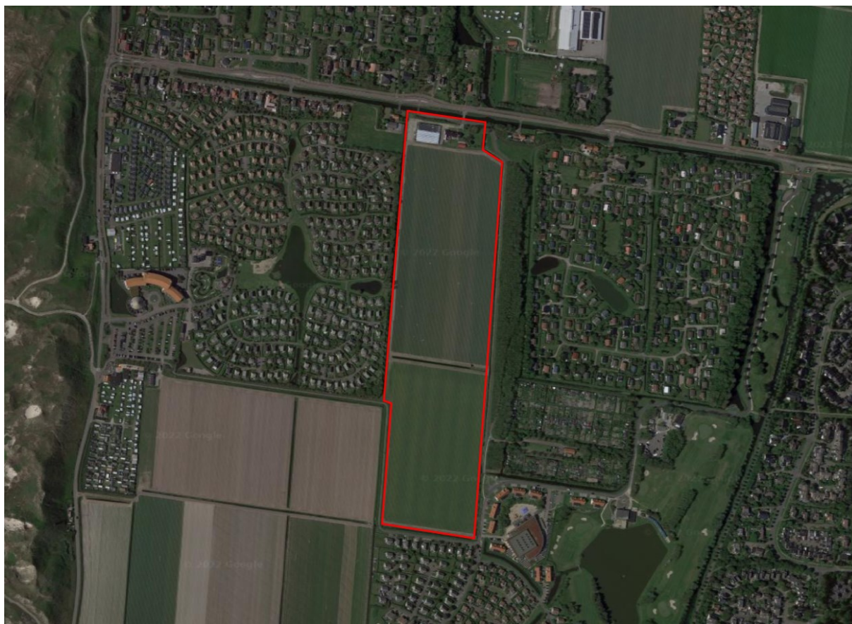
Figuur 1 | Luchtfoto locatie