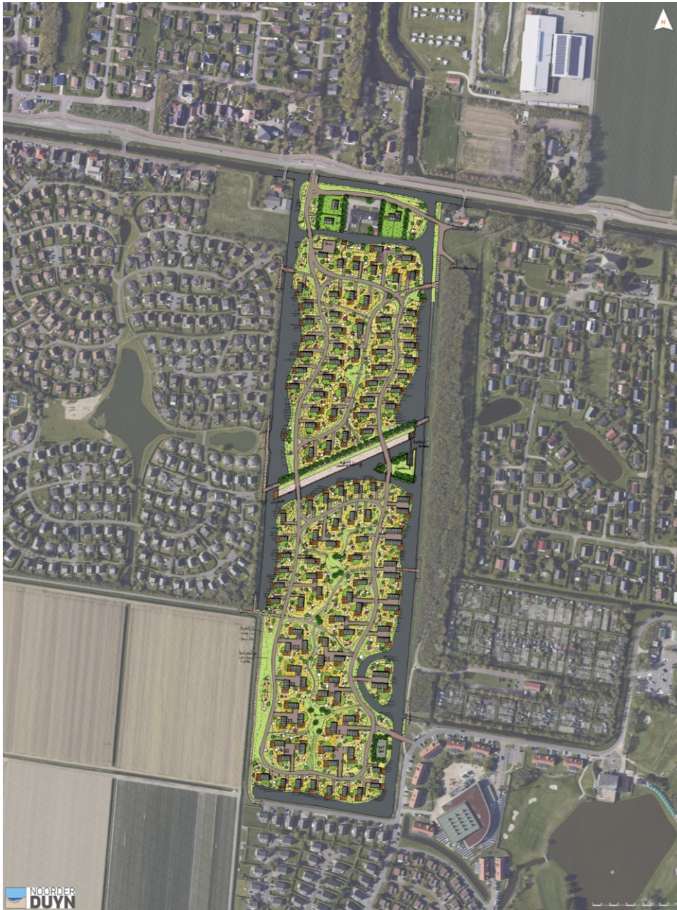
Figuur 3 | Situatieschets planvoornemen

Start van de aanlegwerkzaamheden zijn voorzien medio 2024.