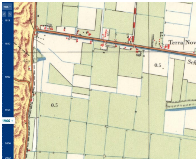
Figuur 2: Kaart uit 1966

Het perceel betreft een akkerperceel (sinds mensenheugenis) waar, tot op heden (2022) bloembollen worden geteeld (11,91 ha.)