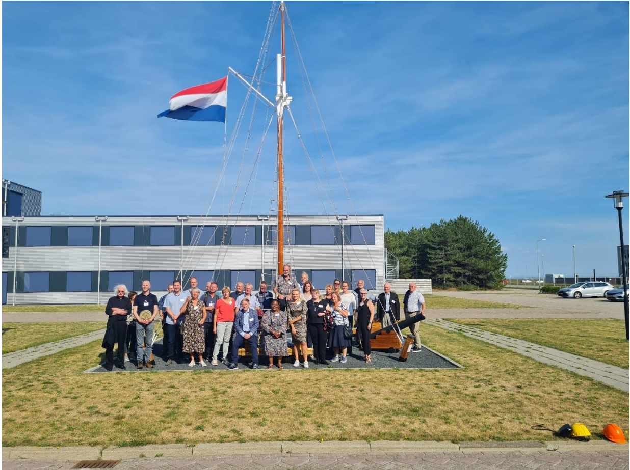
Fotomoment van een groep raadsleden