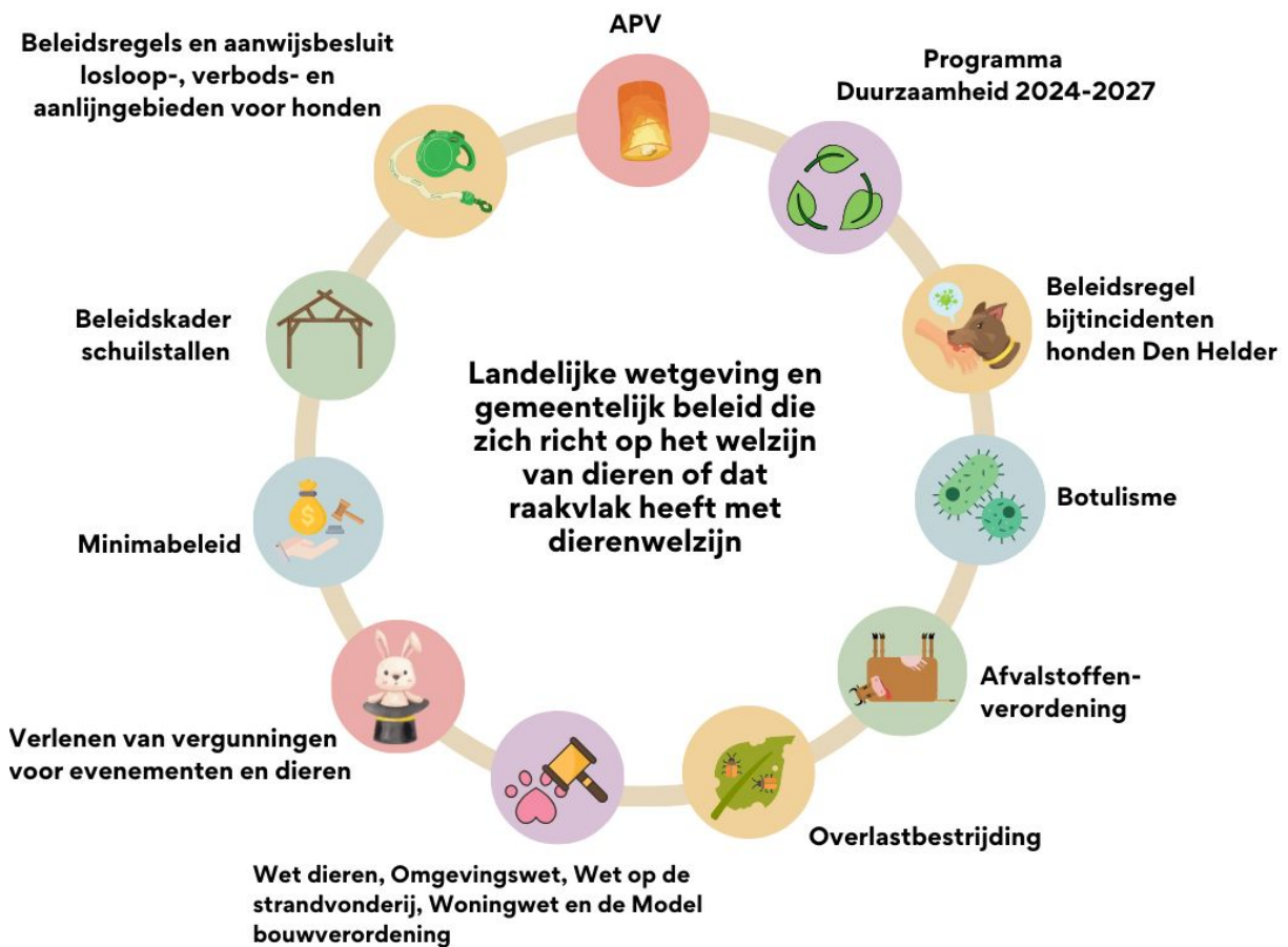
Figuur 2: Landelijke wetgeving en gemeentelijk beleid die zich richt op het welzijn van dieren of dat raakvlak heeft met dierenwelzijn.