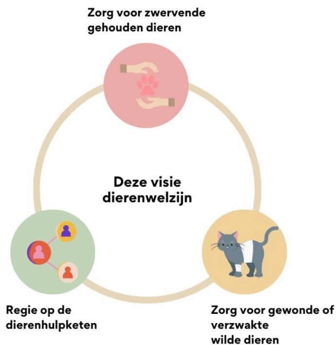
Figuur 1: De visie Dierenwelzijn focust zich op het helpen van (gehouden en wilde) dieren in nood.

Net als alle andere gemeenten heeft de gemeente Den Helder verschillende taken en verantwoordelijkheden op het gebied van dierenwelzijn. Hierbij maken we onderscheid tussen taken die wettelijk verplicht zijn en aanvullende taken waar we zelf voor kiezen. In beide gevallen ligt onze focus op het helpen van (gehouden en wilde) dieren in nood. Daarnaast is er nog landelijke wetgeving en ander gemeentelijk beleid die zich richten op het welzijn van dieren of dat raakvlak heeft met dierenwelzijn (zie onderstaande figuren). In dit hoofdstuk wordt hier aandacht aan besteed.